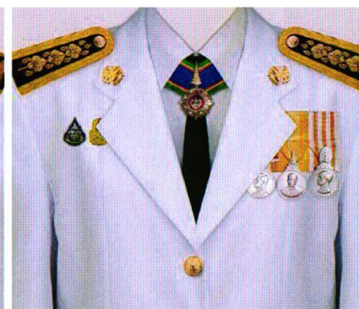
การแต่งกายชุดเต็มยศ สตรี ต.ม.

TheMedal TheMedal เป็นแพลตฟอร์มดิจิทัลที่ช่วยอำนวยความสะดวกในการค้นหาและสั่งซื้อเหรียญรางวัลและเครื่องราชอิสริยาภรณ์ ภาพมีลิขสิทธิ์ ห้ามนำไปใช้ทางการค้า