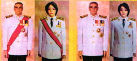
ป.ม. - ป.ช. สายสะพายขาว, ม.ว.ม. - ม.ป.ช. สายสะพายฟ้า

ประดับคาราที่มีลำดับเกียรติสูงสุดไว้ใกล้แนวรวงคุม ส่วนคาราที่มีลำดับเกียรติรองลงไป ประดับต่ำกว่า หรือเอียงไปทางซ้ายของลำตัว