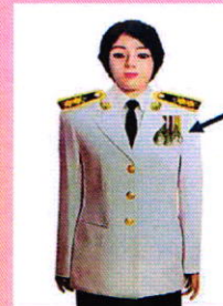
เครื่องแบบเต็มยศและครึ่งยศ

ประดับแพรแถบ เหรียญที่พระราชทานเป็นที่ระลึก ในโอกาสต่าง ๆ แบบบุรุษ ที่อกเสื้อเบื้องซ้าย