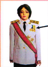
เครื่องแบบเต็มยศ

ประดับดารา ดวงตรา และสวมสายสะพายเช่นเดิม