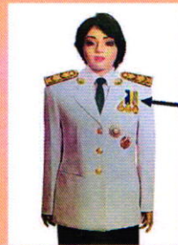
เครื่องแบบครึ่งยศ

เหรียญราชอิสริยาภรณ์ เช่น เหรียญจักรพรรดิมาลา เหรียญที่พระราชทานเป็นที่ระลึก ในโอกาสต่าง ๆ ให้ประดับโดยใช้แพรแถบ แบบบุรุษ