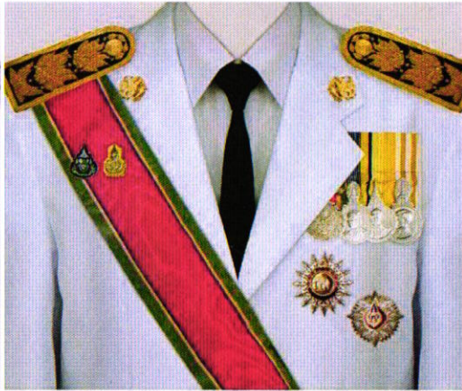
การแต่งกายชุดเต็มยศ สตรี ป.ช. / ป.ม. / ร.จ.พ.

TheMedal TheMedal เป็นแพลตฟอร์มดิจิทัลที่ช่วยอำนวยความสะดวกในการค้นหาและสั่งซื้อเหรียญรางวัลและเครื่องราชอิสริยาภรณ์ ภาพมีลิขสิทธิ์ ห้ามนำไปใช้ทางการค้า