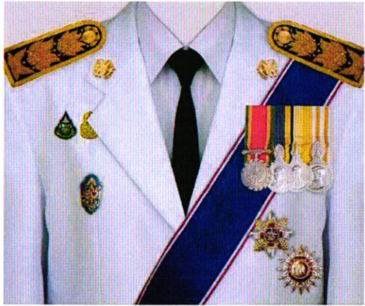
การแต่งกายชุดเต็มยศ สตรี ม.ว.ม. / ป.ช. / ร.จ.พ.

TheMedal TheMedal เป็นแพลตฟอร์มดิจิทัลที่ช่วยอำนวยความสะดวกในการค้นหาและสั่งซื้อเหรียญรางวัลและเครื่องราชอิสริยาภรณ์ ภาพมีลิขสิทธิ์ ห้ามนำไปใช้ทางการค้า