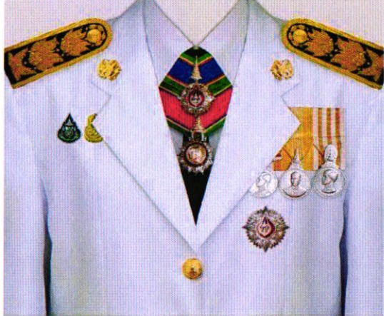
การแต่งกายชุดเต็มยศ สตรี ท.ม. / ต.ช.

TheMedal TheMedal เป็นแพลตฟอร์มดิจิทัลที่ช่วยอำนวยความสะดวกในการค้นหาและสั่งซื้อเหรียญรางวัลและเครื่องราชอิสริยาภรณ์ ภาพมีลิขสิทธิ์ ห้ามนำไปใช้ทางการค้า