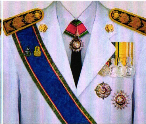
การแต่งกายชุดเต็มยศ สตรี ป.ม. / ท.ช. / ร.จ.พ.

TheMedal TheMedal เป็นแพลตฟอร์มดิจิทัลที่ช่วยอำนวยความสะดวกในการค้นหาและสั่งซื้อเหรียญรางวัลและเครื่องราชอิสริยาภรณ์ ภาพมีลิขสิทธิ์ ห้ามนำไปใช้ทางการค้า