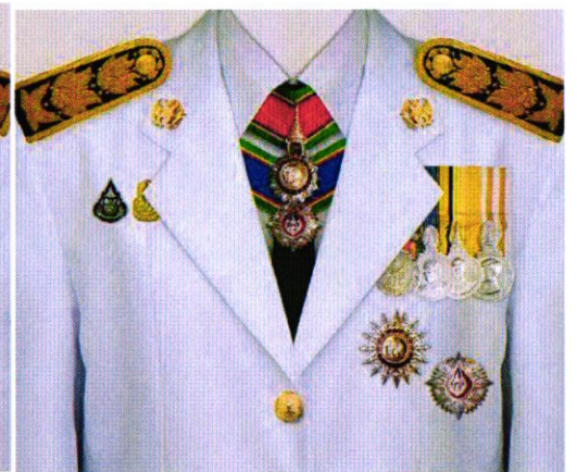
การแต่งกายชุดเต็มยศ สตรี ท.ช. / ท.ม. / ร.จ.พ.

TheMedal TheMedal เป็นแพลตฟอร์มดิจิทัลที่ช่วยอำนวยความสะดวกในการค้นหาและสั่งซื้อเหรียญรางวัลและเครื่องราชอิสริยาภรณ์ ภาพมีลิขสิทธิ์ ห้ามนำไปใช้ทางการค้า